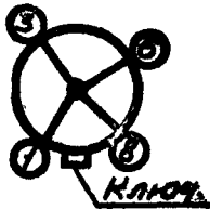
Схема соединения электродов преобразователя со штырьками

1.3. Сопротивление термопары должно быть от 6 до 8 Ом.